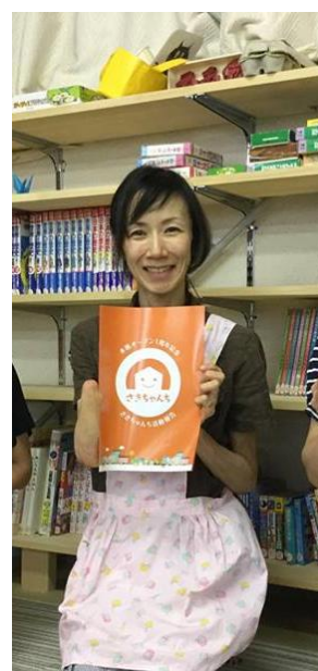
2017年度運営委員およびサポーターさん