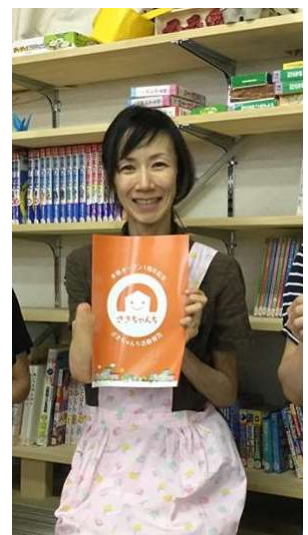
2018年度運営委員およびサポーターさん