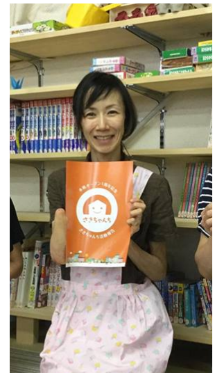
2018年度運営委員およびサポーターさん